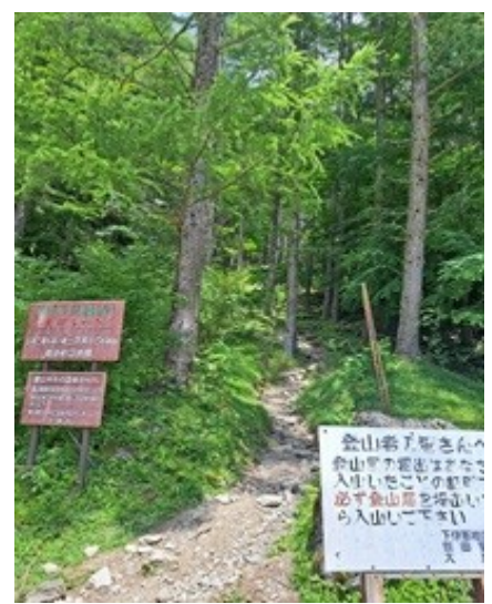
鳥倉登山口 これより登山道