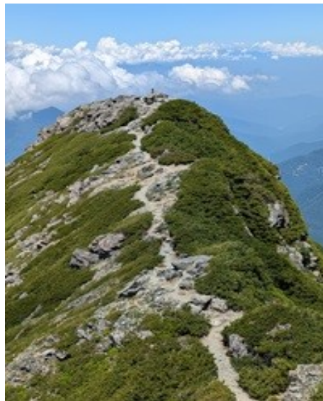
雲に通じる山道のよう