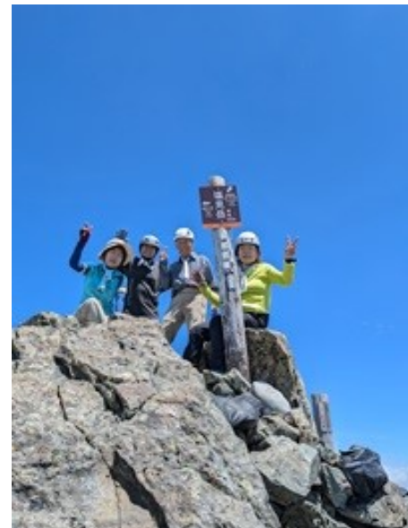
塩見岳 東峰 イエーイ!