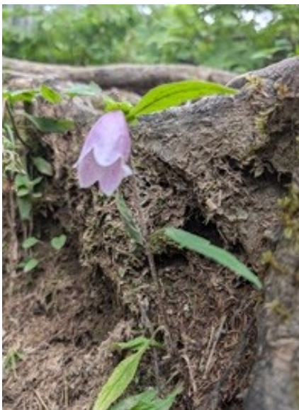
ヤマホタルブクロ