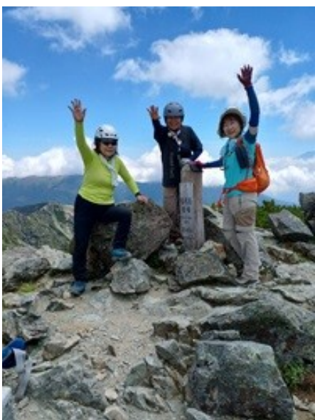
塩見岳 西峰 ご陽気三人娘