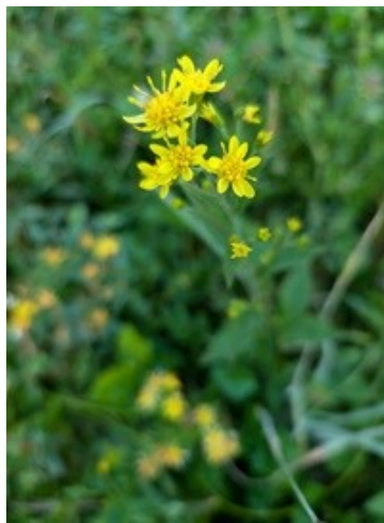
ミヤマアキノキリンソウ