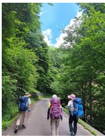
登山口までの林道歩き