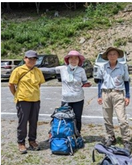
鳥倉林道ゲート さあ、ここからスタート 歩きます