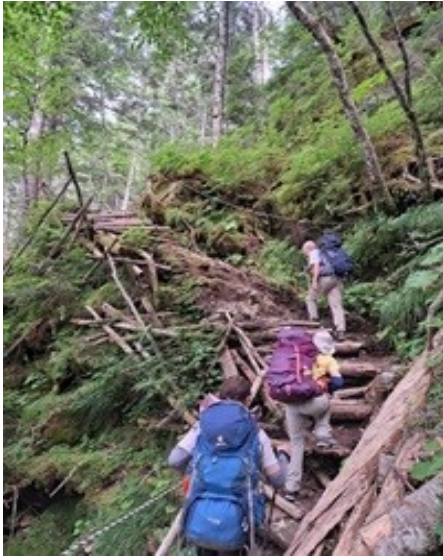
今にも壊れそうな木ハシゴ