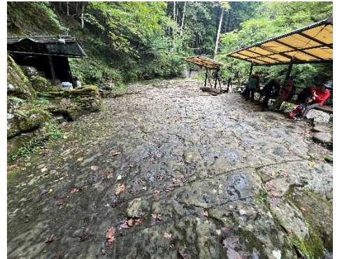
12 百畳岩まで戻って、昼食タイム。