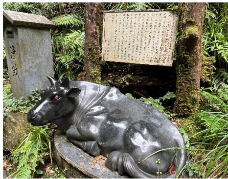
2 赤目の名前の由来の赤目の牛。