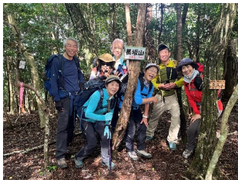
17 長坂山の山頂に到着。