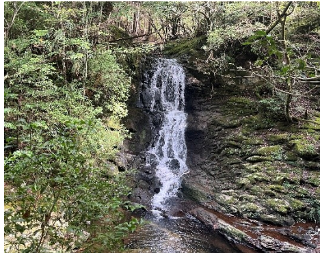
11 岩窟滝。ここで引き返します。