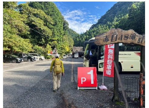
18 無事下山してきました。