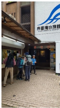
1 水族館で滝の入場料を払います。