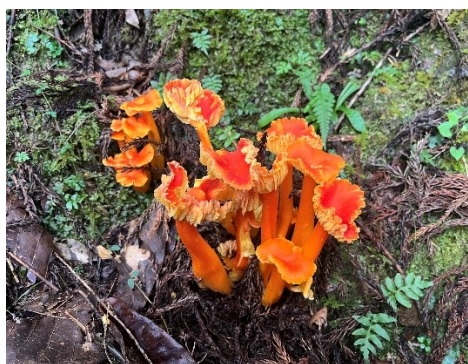
14 派手な色をしたキノコ。