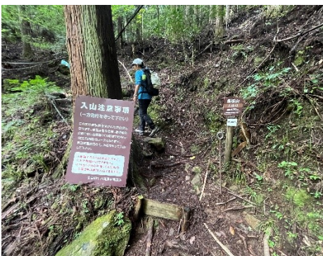
13 登山口。いきなりの急登でした。