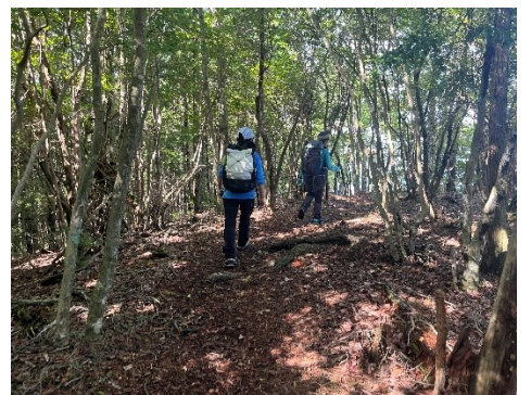
15 気持ちのいい登山道です。