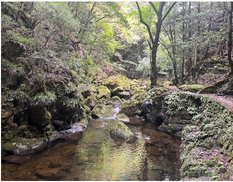
7 苔むした溪谷が美しい。