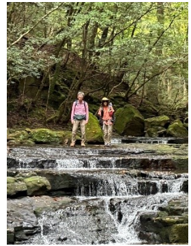
9 雛段滝に、お内裏様とお姫様。