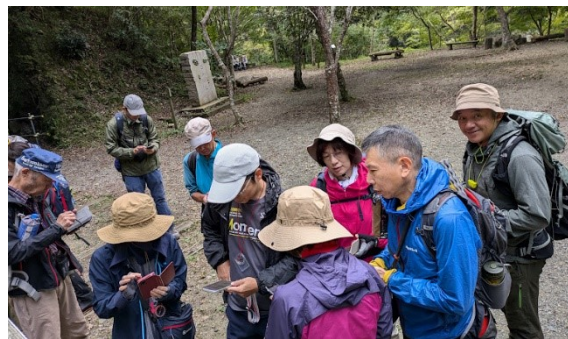
桜の園入り口でアプリで次の地点にマーカーを合わせる