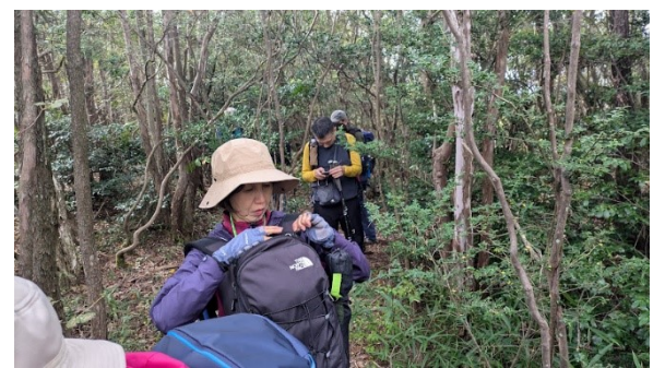
次は安倉山へ だんだんと道が不明瞭となる