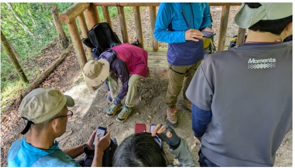
四阿に着き、しばし休憩