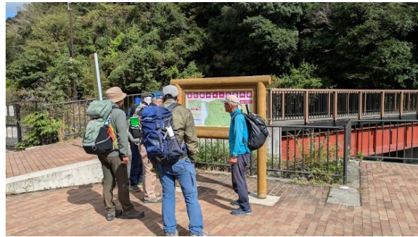
エントランス広場から出発