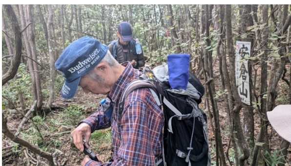
この辺一帯が安倉山