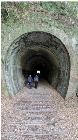
廃線敷のトンネルの中を進む