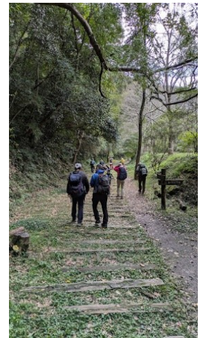
旧国鉄福知山線廃線敷を進む