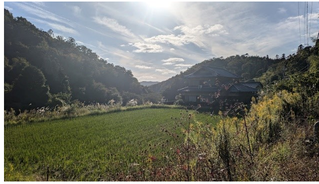
田園地帯を過ぎ、武田尾はもう間近