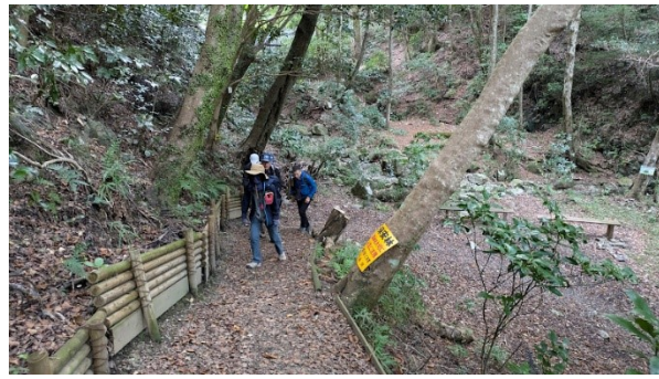
四阿に向けひたすら登る