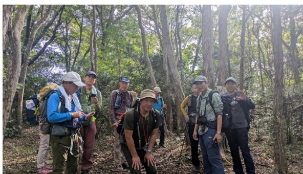
安倉山を過ぎて大峰山の稜線に出た