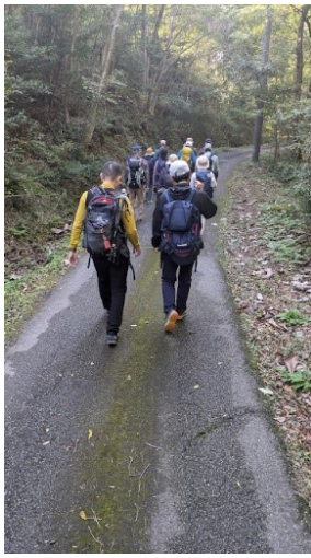
武田尾への林道をひたすら歩く