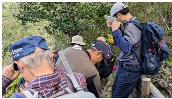
途中で山座同定のレクチャー