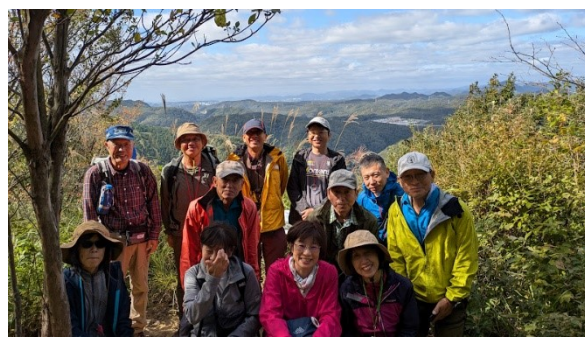
つつじヶ丘展望所にてみんな集合！