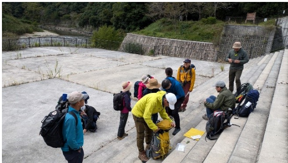
桜の園のエントラス広場でGPSアプリのレクチャーを受け、出発準備をする