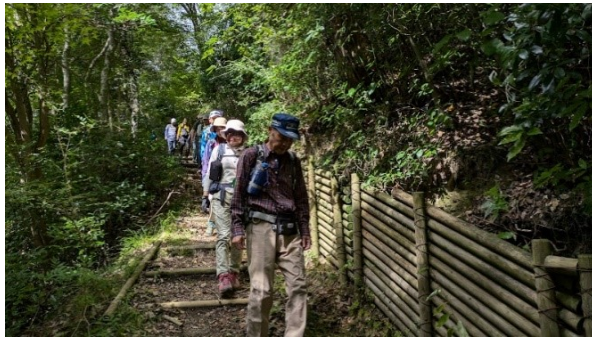
次は一旦沢へと下る