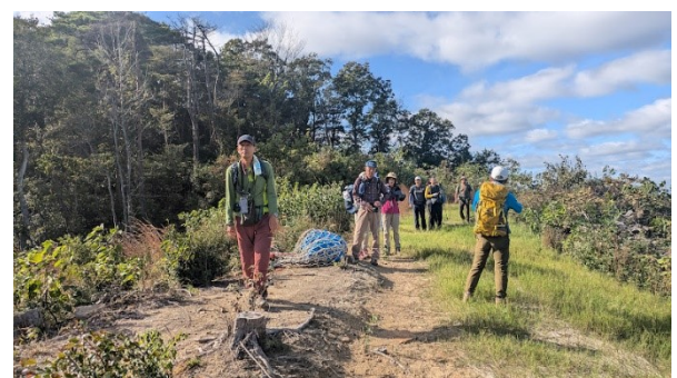
下山を開始し、高圧鉄塔下に出た