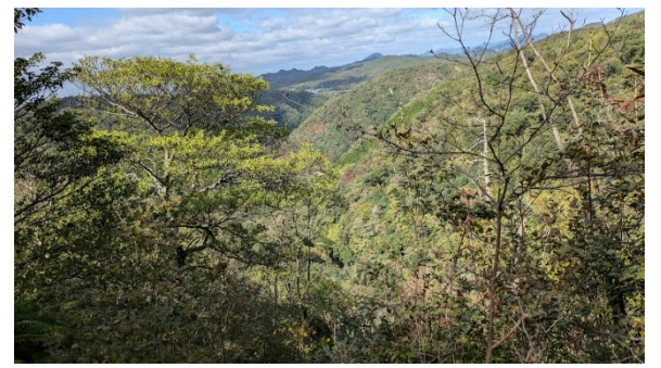
山座同定を試みる 羽東山を同定する