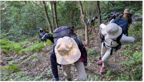
沢からは急登が続く