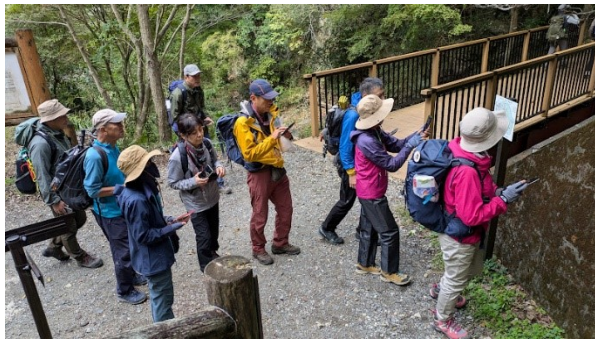
桜の園入り口から山中に出発