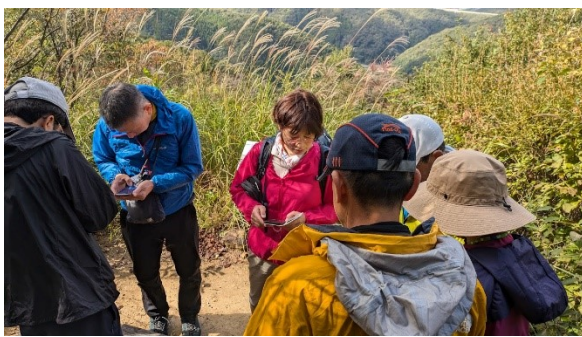
ポイント毎に次の地点にマーカーをセットする バックに秋らしいスキの穂が...