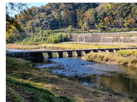
恋志谷神社を後にして沈下橋へ