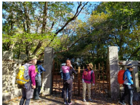
笠置山山頂はこの鉄の扉の中、近づけません(御在所跡)