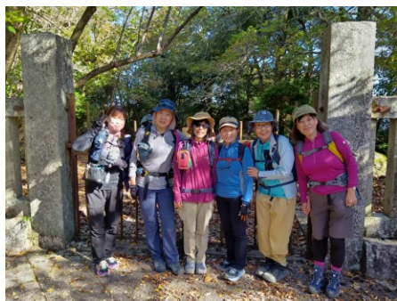
笠置山山頂、鉄の扉の前で