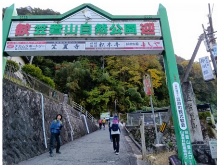
ここを潜ってすぐ右手に⇨