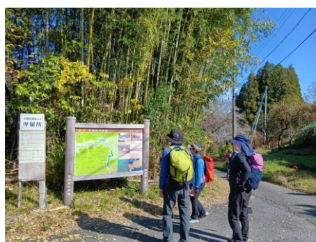
再び木津川沿いの道へ