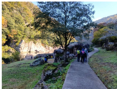
木津川沿いの銀の帯コース