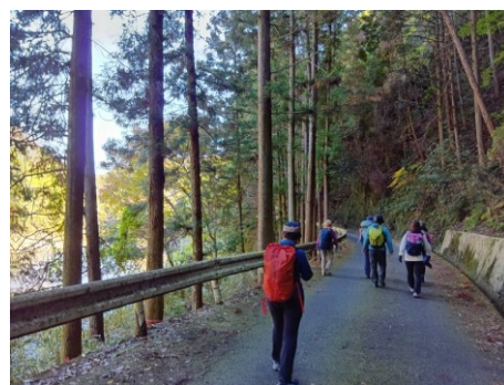
お昼の休憩の後出発