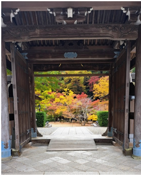
額縁で切り取ったように愛でる