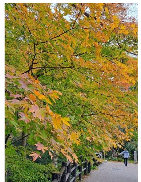
こんな色合いも好みです