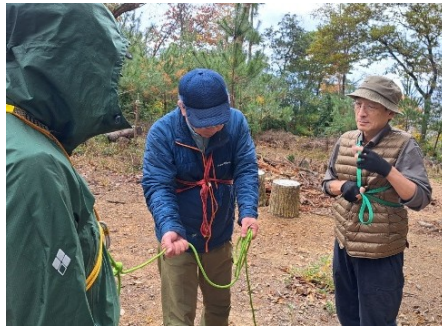
適切なスリングの長さ、幅は…