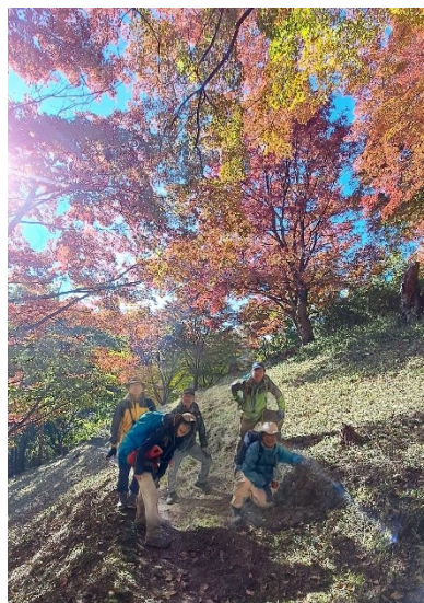
皆さんに後光が差しています