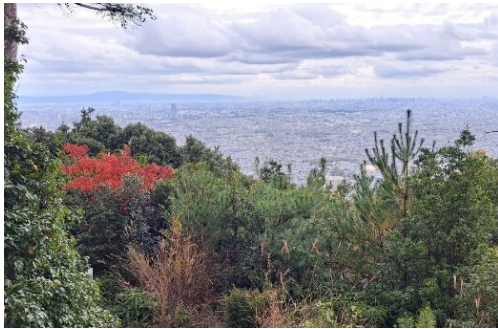
怪しい雲行き。市街は霞んでいます