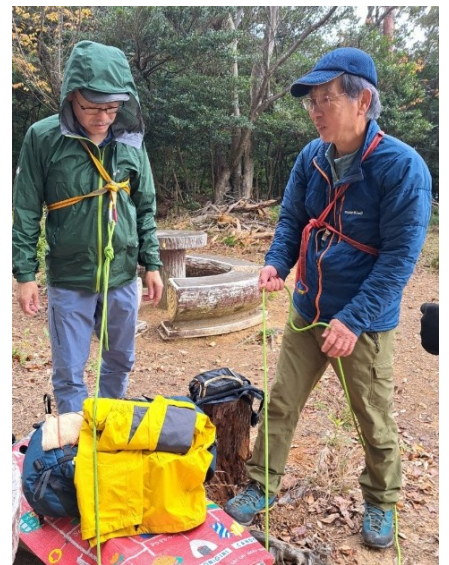
お助けロープの役割は…