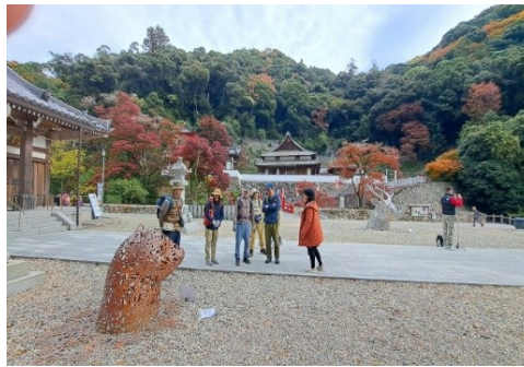
瀧安寺境内にはアート作品が点々と