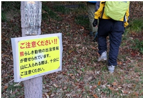
池田市にも熊らしきものが…