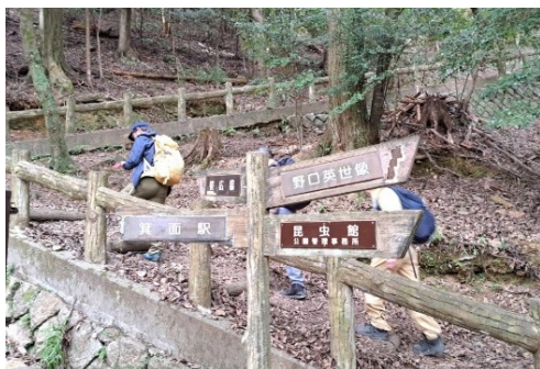
いよいよ六箇山へ向かいます