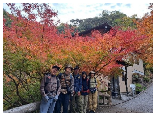
グラデーションがきれい