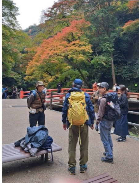
平日のお陰で人もほとんど