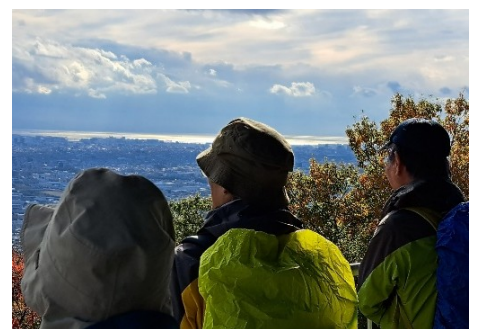
霞んでいた海面がまぶしい