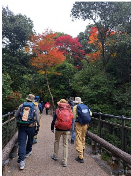
色づきに期待し、進みます