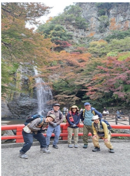
滝周辺の色づきは今一つ