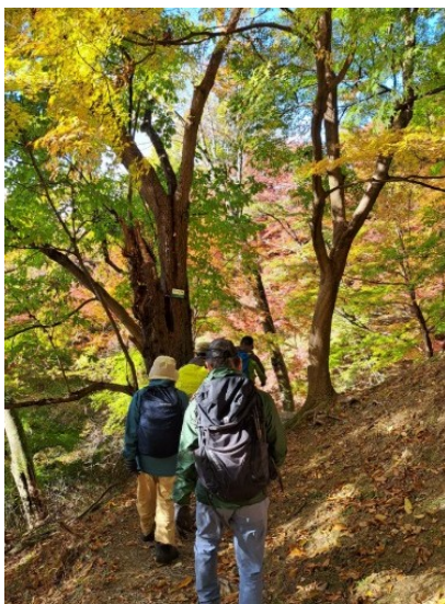
雨雲も去り、気持ちの良い散策