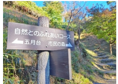
周遊コースを楽しみました