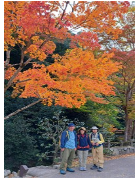
実物の鮮やかさは撮れない…