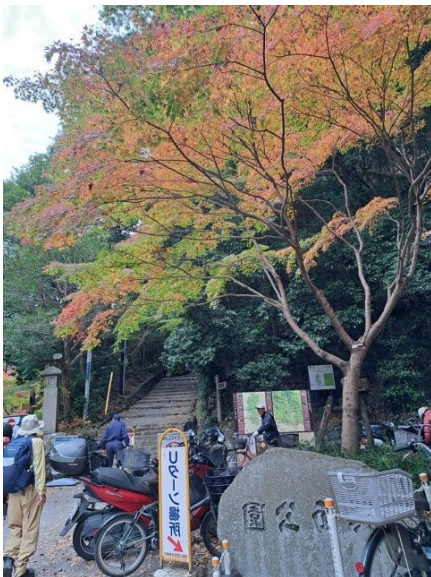
箕面公園入口 色づきは淡い…

関西の紅葉スポットの代表、箕面大滝から池田駅へ、様々な色合いと光彩の紅葉を楽しむ山行となりました。どの山も単独で登ったことはありませんが、続けて歩いた経験はありませんでした。六箇山山頂では雨模様となり、皆レインを着込むほどの気温差もあり、近い山ですが装備の大切さを改めて実感しました。五月山公園では雨雲も去り、キラキラとまぶしい木々の中を歩けたこと、市街地で虹に出会えたことなどご褒美の多い山行でした。(H.K)