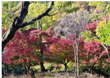
五月山公園内の色づきも見事です