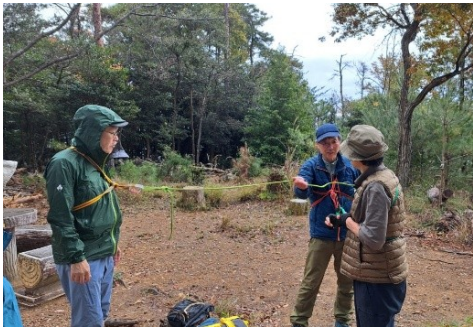
やおら、始まる簡易ハーネス講習会