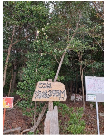
六箇山に到着。昼食、雨模様。