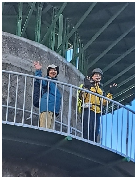
ヤッホー！ 展望台にも、登る