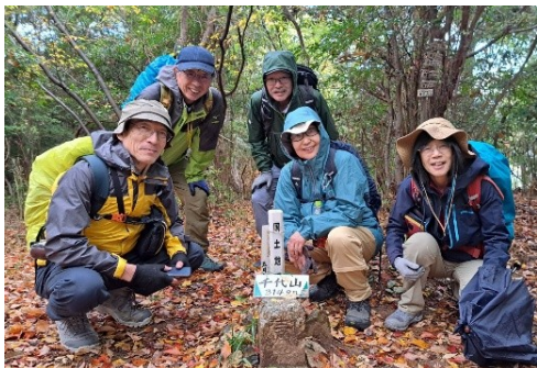
五月山は五月山にあらず