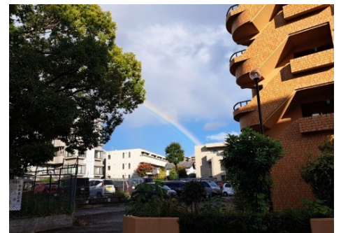
市街地へ降りると虹…。