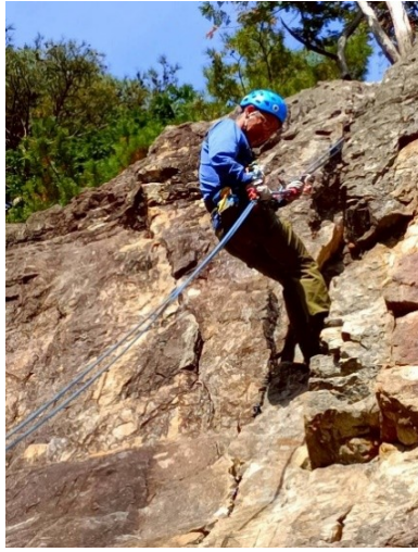
まずは懸垂下降から始まり