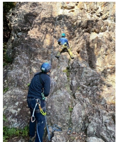
トップロープクライミングとビレイ