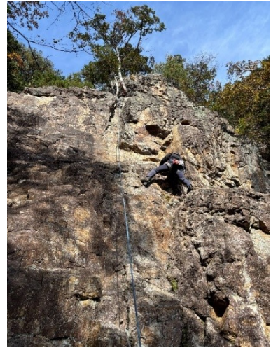
トップロープでクライミング1