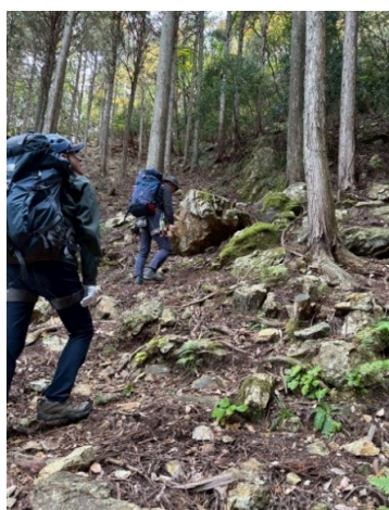
急斜面のアプローチ