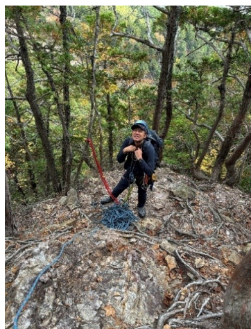
ビレイの準備 セルフも取ってます クライマー登ります