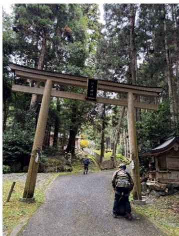
登山口の江文神社で駐車

京都大原の里に金毘羅山の岩場があり、泊りで のクライミングを楽しんだ。1日目は北尾根をアルパイン クライミングで楽しみ2日目はホワイトチムニーで懸垂 や登攀の練習を重ねた。 宿泊は寂光院の隣なので朝の散歩で紅葉を楽しむ。 たまには大名クライミングツアーも良いもんだ(記K I)