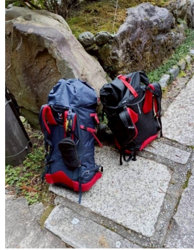
お気に入りMILLETのザック