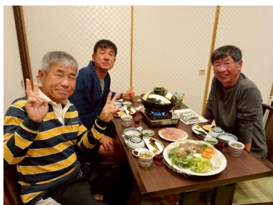
お待ちかねの夕食 まずはビールで乾杯!! 永遠 4時間コース