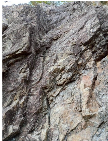
今から登る岩壁の一部