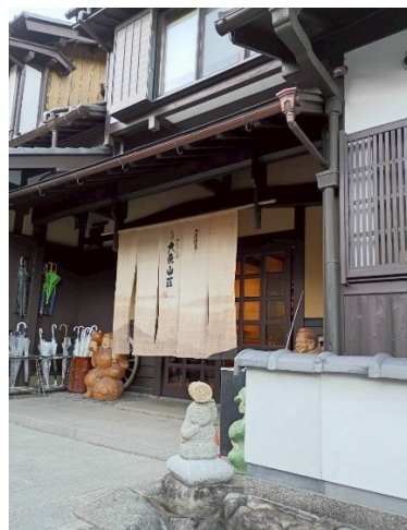
今日の宿 大原山荘