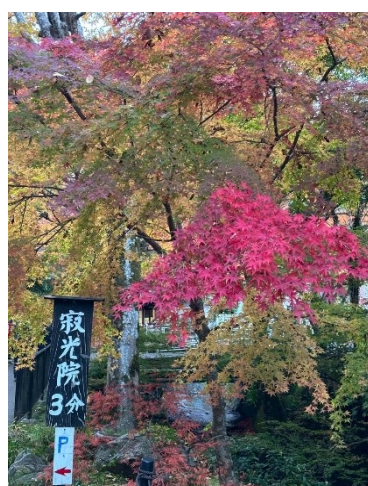
朝の散策 二日酔い無し