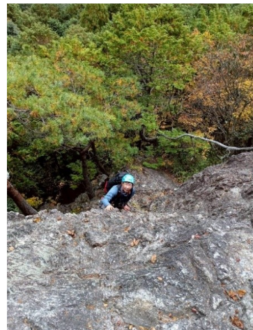
リードで登るので岩の観察