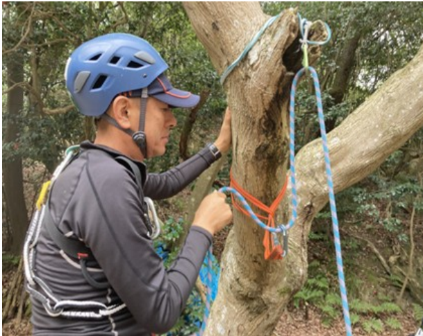
1. 危険な Z クリップ防止の演習