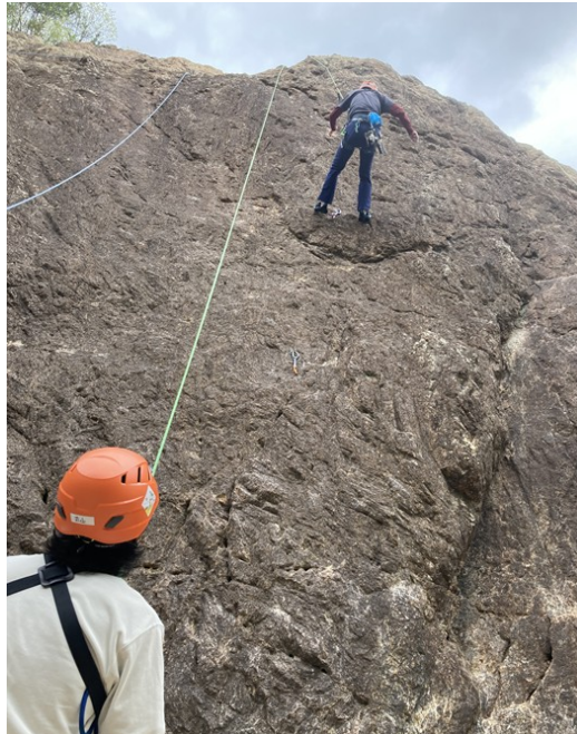
3. 支点構築後の下降