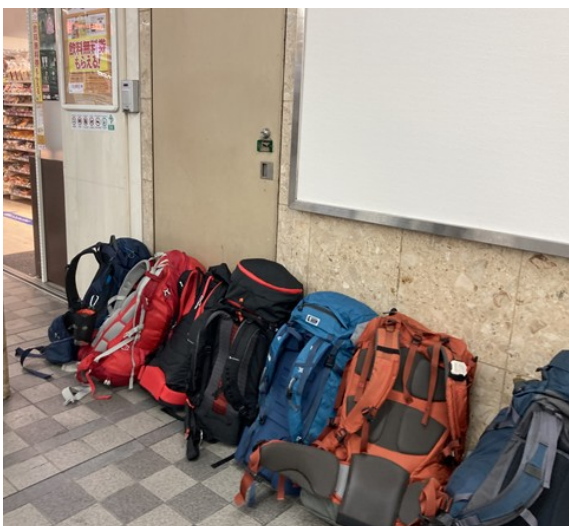
5 コンビニで飲料を求め交流会へ