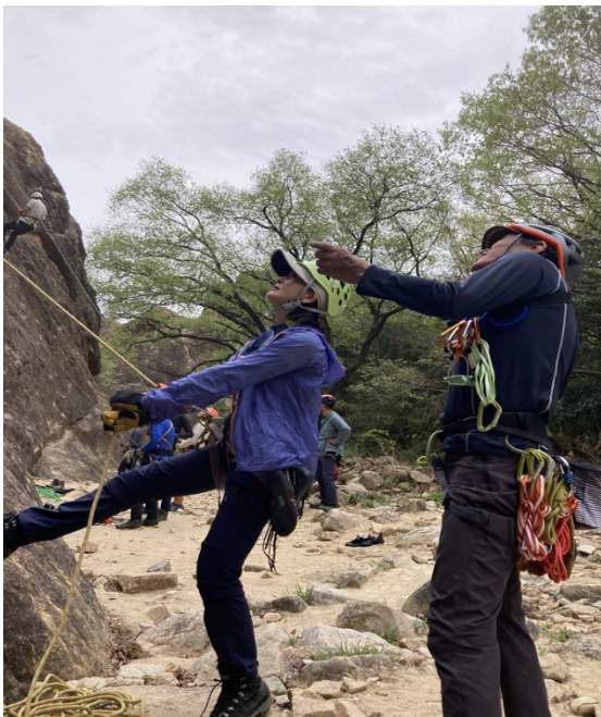
2. ビレイの要点の確認