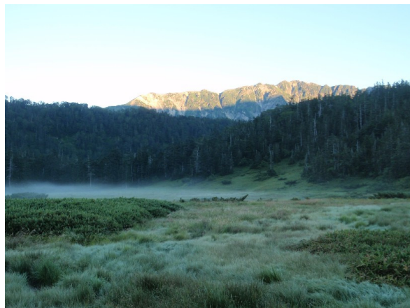
水晶池 水晶岳が湖面に映る