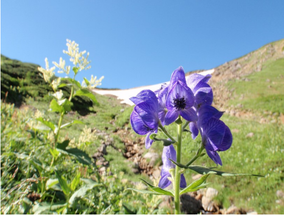
乗越が近い 岩苔小谷源頭部