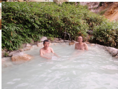
11:40 高天原山荘 (今日はここで泊)