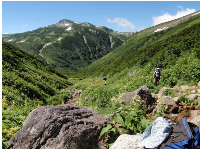
ここから黒部源流へと下りる。山は三俣蓮華岳