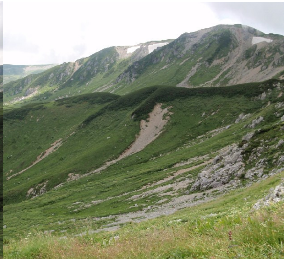
槍の穂先が見え隠れ