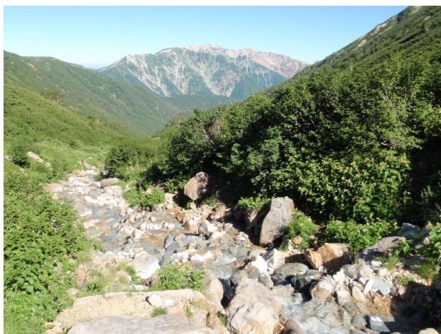
岩苔小谷上部から 薬師岳が大きい