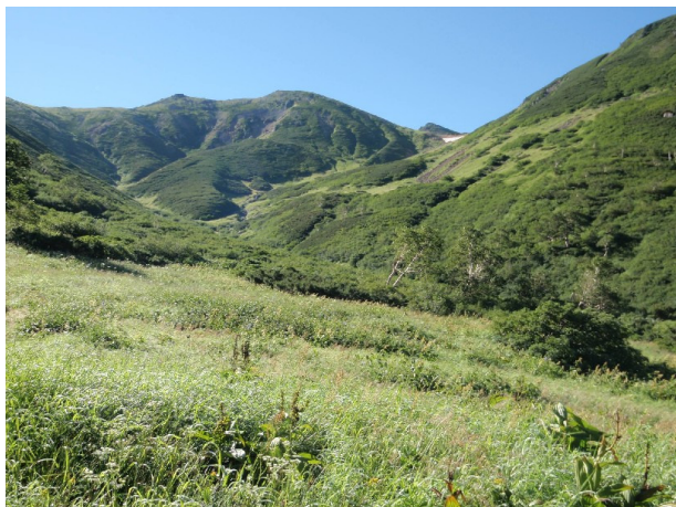
岩苔乗越への登り 高山植物が豊富なところ