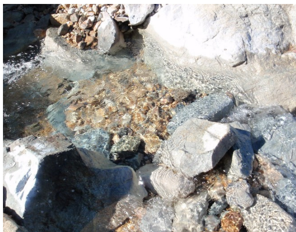
清冽な水 冷たい、うまい！