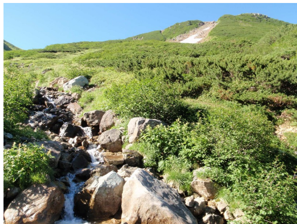
岩苔小谷をつめる