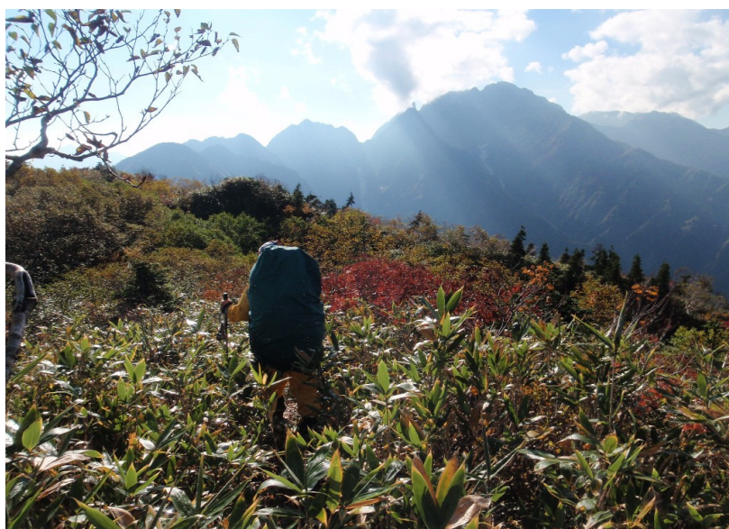
ブッシュでトレース薄い。常に劔岳を右手に見ながら