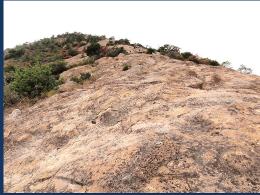
百間岩 (取り付きから仰ぎ見る)