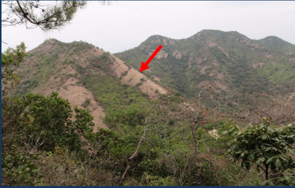
百間岩(高低差 150m)と鷹ノ巣山(右奥)