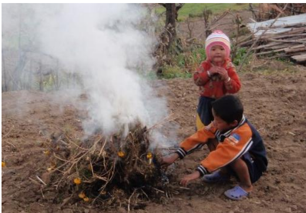
忘れていた懐かしい風景