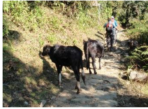
トルカ から ランドルンへ