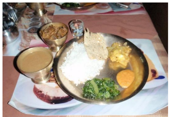
ネパールの家庭料理です →