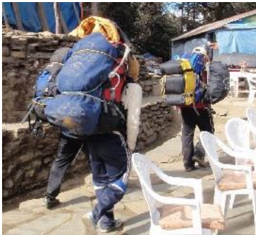
我らがポーター達