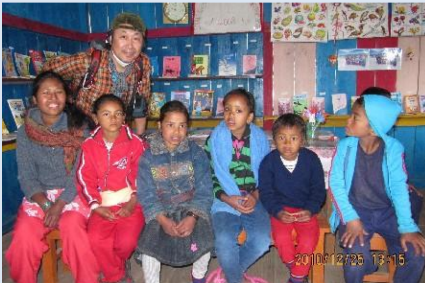
ノート、鉛筆などを寄付した図書館で。休日だったがみんな集まってくれた