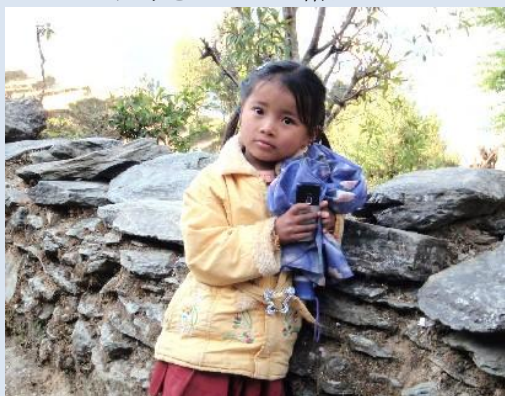
お母さん？と一緒に