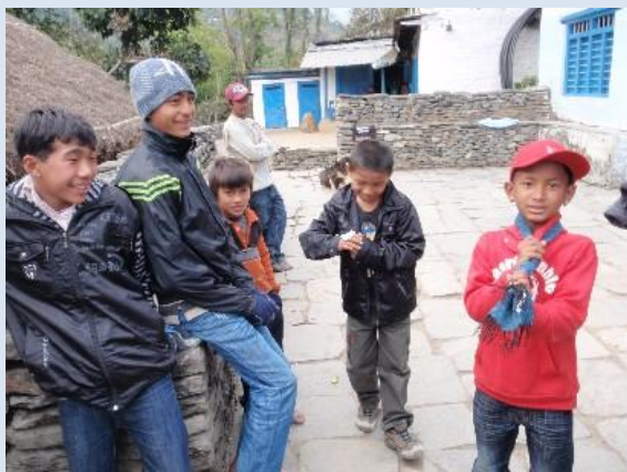
こま回しに興じる