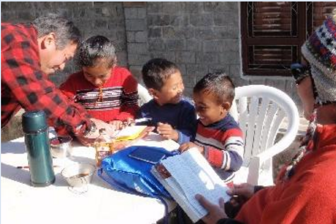
鉛筆と消しゴムをプレゼント