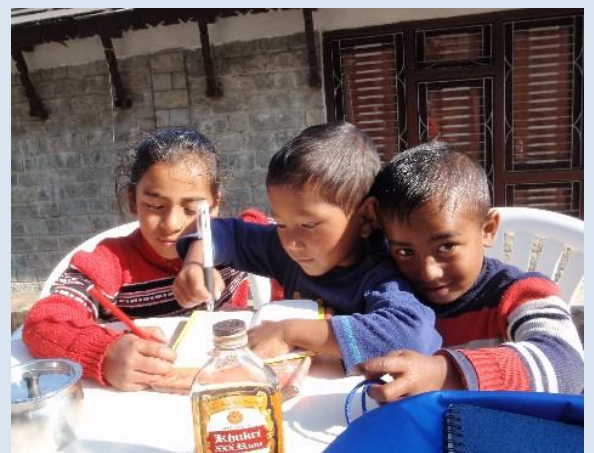
絵を描く子どもたち