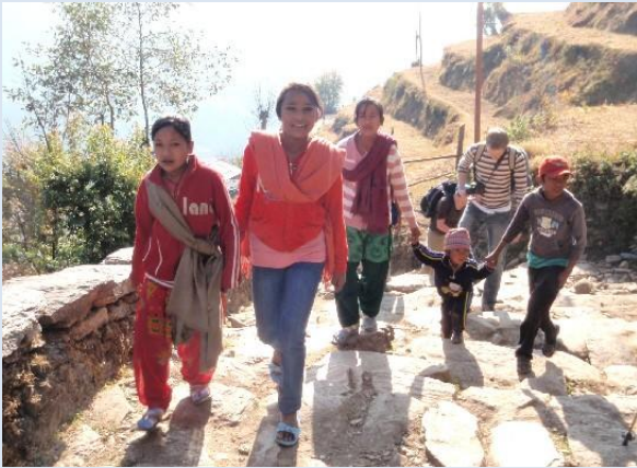
今日はX' mas。 みんなで着飾って教会へ