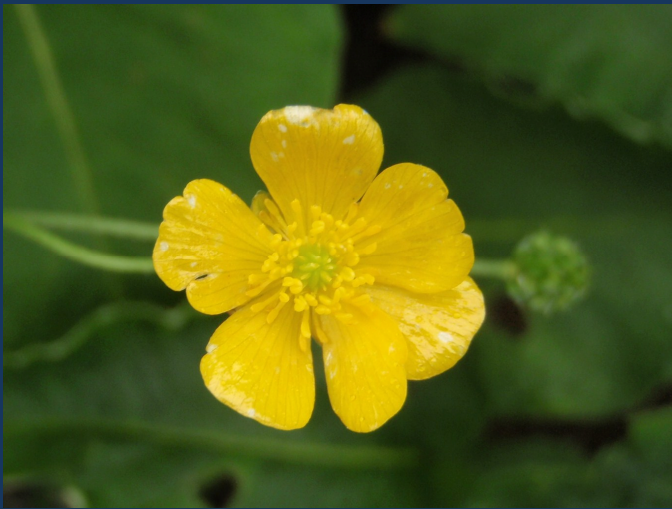
ミヤマキンポウゲ?