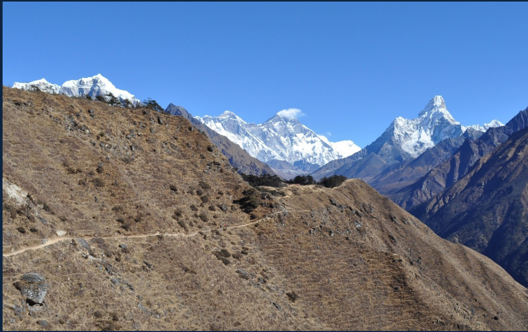
エベレスト 8848 メートル (300mm望遠で撮影)