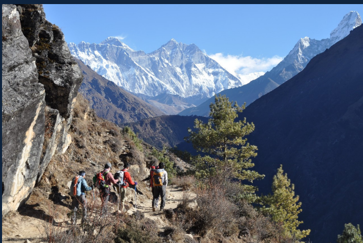
エベレストを目指して